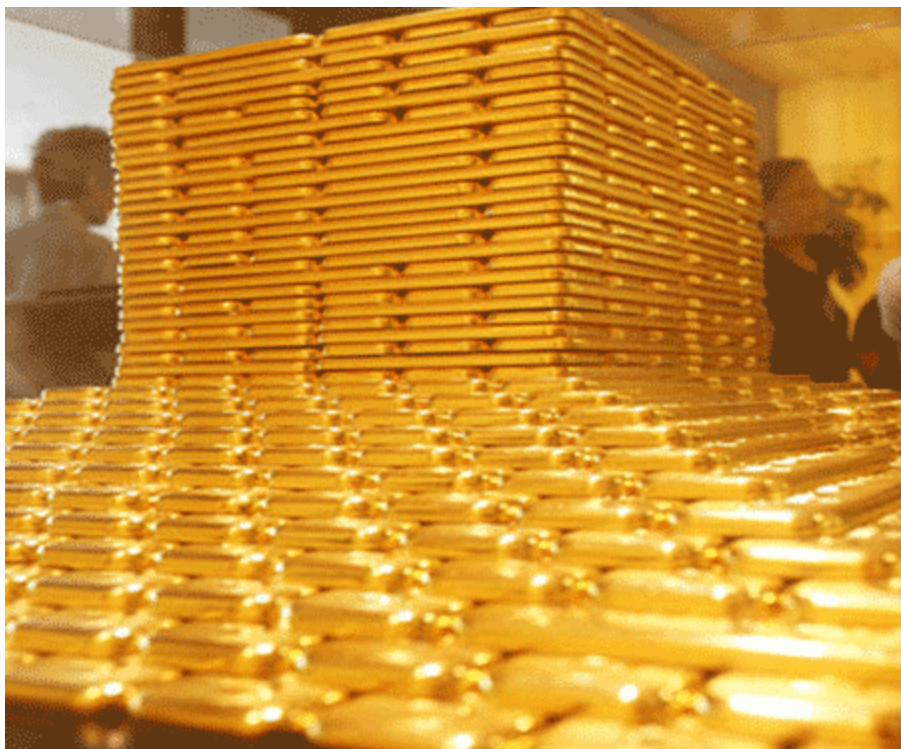
信心比黄金更重要!